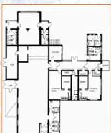
ਮੌਜੂਦਾ ਸਿਲਡਿੰਗ ਜੋ ਕਿ ਇੱਕ ਫੁੱਟਬਾਲ ਕਲੱਬ ਦੇ ਤੌਰ ਤੇ ਵਰਤੀ ਜਾ ਰਹੀ ਸੀ ਉਸਦਾ ਨਕਸ਼ਾ

ਨੋਟ: ਕਿਰਪਾ ਕਰਕੇ ਆਪਣਾ ਪੂਰਾ ਨਾਮ ਬੈਂਕ ਟਰਾਂਸਫਰ ਦੀ ਚੈਕਬੁੱਕ ਵੇਲੇ ਜ਼ਰੂਰ ਲਿਖੋ ਜੀ। ਧੰਨਵਾਦ।