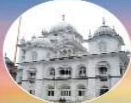
ਤਖਤ ਸ੍ਰੀ ਹਰਿਮੰਦਰ ਜੀ ਪਟਨਾ ਸਾਹਿਬ