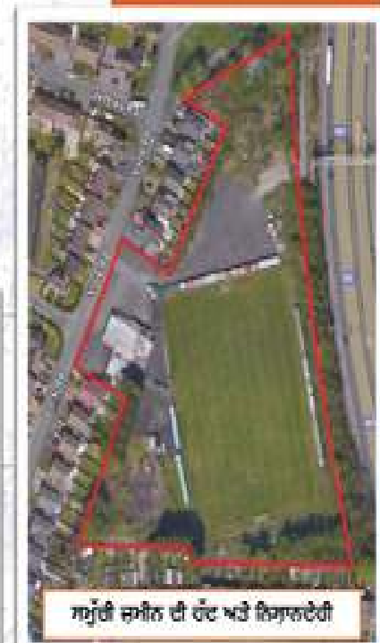
ਸਮੁੱਚੀ ਜ਼ਮੀਨ ਦੀ ਹੱਦ ਅਤੇ ਇਮਾਰਤਦੇਹੀ