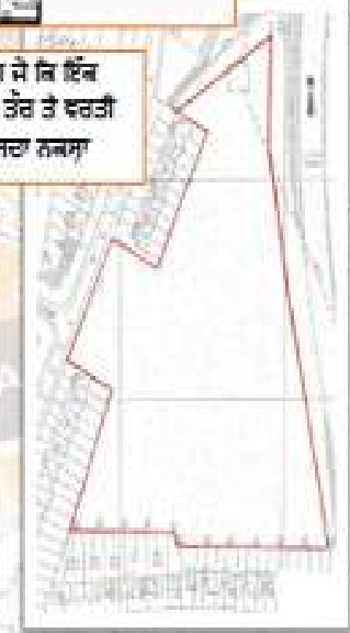
ਜ਼ਮੀਨ ਦੀ ਹੱਦਦੇਹੀ (Scale 1: 1250)