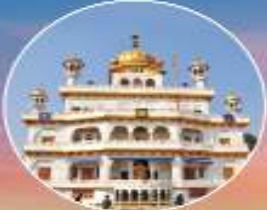
ਸ੍ਰੀ ਅਕਾਲ ਤਖਤ ਸਾਹਿਬ ਸ੍ਰੀ ਅੰਮ੍ਰਿਤਸਰ ਸਾਹਿਬ