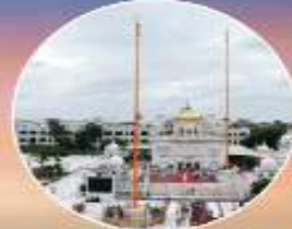
ਤਖਤ ਸ੍ਰੀ ਹਜ਼ੂਰ ਸਾਹਿਬ ਅਬਿਚਲ ਨਗਰ (ਨੰਦੇੜ)