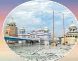
ਤਖਤ ਸ੍ਰੀ ਦਮਦਮਾ ਸਾਹਿਬ ਤਲਵੰਡੀ ਸਾਬੋ (ਬਠਿੰਡਾ)