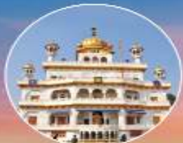
ਸ੍ਰੀ ਅਕਾਲ ਤਖਤ ਸਾਹਿਬ ਸ੍ਰੀ ਅੰਮ੍ਰਿਤਸਰ ਸਾਹਿਬ