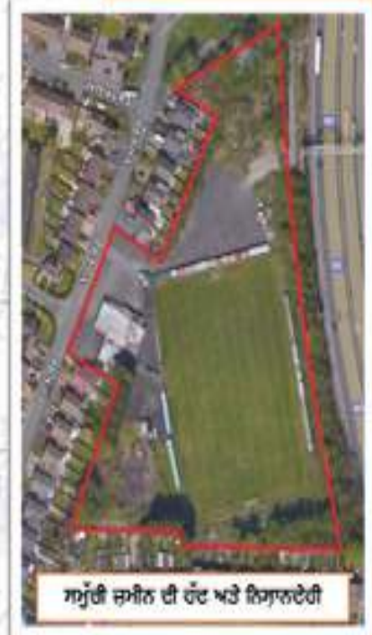
ਸਮੁੱਚੀ ਜ਼ਮੀਨ ਦੀ ਹੱਦ ਅਤੇ ਨਿਸ਼ਾਨਦੇਹੀ