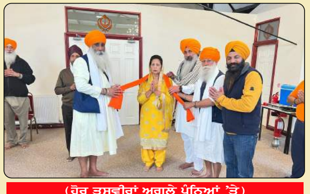
(ਹੋਰ ਤਸਵੀਰਾਂ ਅਗਲੇ ਪੰਨਿਆਂ 'ਤੇ)