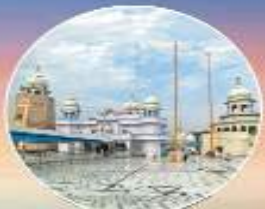
ਤਖਤ ਸ੍ਰੀ ਦਮਦਮਾ ਸਾਹਿਬ ਤਲਵੰਡੀ ਸਾਹਿਬ (ਥਰਿੰਡਾ)