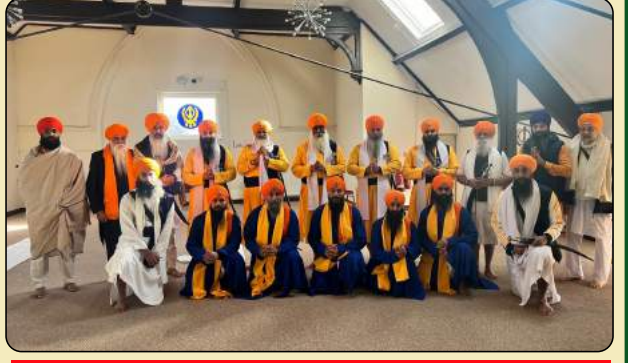
(ਹੋਰ ਤਸਵੀਰਾਂ ਅਗਲੇ ਪੰਨਿਆਂ 'ਤੇ)