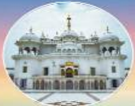
ਤਖਤ ਸ੍ਰੀ ਕੋਸ਼ਗੜ੍ਹ ਸਾਹਿਬ ਸ੍ਰੀ ਅਨੰਦਪੁਰ ਸਾਹਿਬ