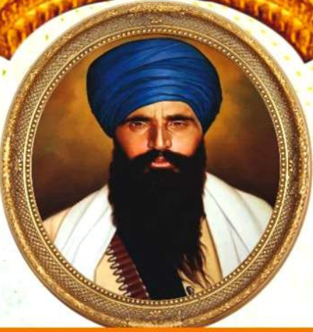
ਅਮਰ ਸ਼ਹੀਦ ਸੰਤ ਗਿਆਨੀ ਜਰਨੈਲ ਸਿੰਘ ਖਾਲਸਾ ਭਿੰਡਰਾਂਵਾਲੇ