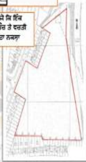
ਜ਼ਮੀਨ ਦੀ ਹੱਦਖੋਰੀ (Scale 1: 1250)