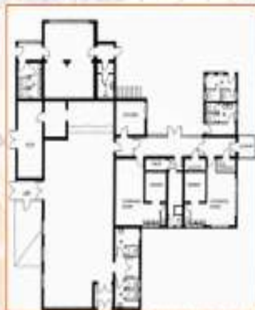
ਮੌਜੂਦਾ ਸਿਲਫਿੰਗ ਜੋ ਕਿ ਇੱਕ ਫੁੱਟਬਾਲ ਕਲੱਬ ਦੇ ਤੌਰ ਤੇ ਵਰਤੀ ਜਾ ਰਹੀ ਸੀ ਉਸਦਾ ਨਕਸ਼ਾ