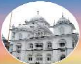
ਤਖਤ ਸ੍ਰੀ ਹਰਿਮੰਦਰ ਜੀ ਪਟਨਾ ਸਾਹਿਬ