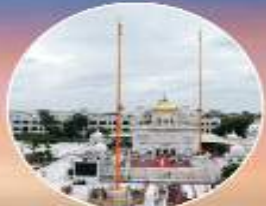
ਤਖਤ ਸ੍ਰੀ ਗੁਰੂ ਸਾਹਿਬ ਅੰਬਾਲਾ ਨਗਰ (ਨੌਦੌੜ)