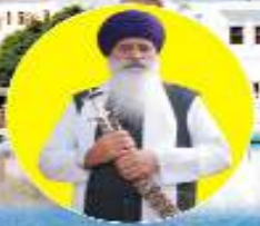
ਸਰਪ੍ਰਸਤ ਸਿੰਘ ਸਾਹਿਬ ਜੀ ਸਮੇਤ ਸਾਡਾ ਸਰਦਾਰ ਸ੍ਰੀ ਅਕਾਲ ਤਖਤ ਸਾਹਿਬ