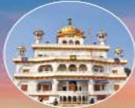
ਸ੍ਰੀ ਅਕਾਲ ਤਖ਼ਤ ਸਾਹਿਬ ਸ੍ਰੀ ਅੰਮ੍ਰਿਤਸਰ ਸਾਹਿਬ