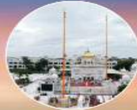
ਤਖ਼ਤ ਸ੍ਰੀ ਗੁਰੂ ਸਾਹਿਬ ਅਭਿਚਲ ਨਗਰ (ਨੌਦੌੜ)