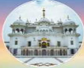
ਤਖ਼ਤ ਸ੍ਰੀ ਕੇਸ਼ਨਗੜ੍ਹ ਸਾਹਿਬ ਸ੍ਰੀ ਅਨੰਦਪੁਰ ਸਾਹਿਬ