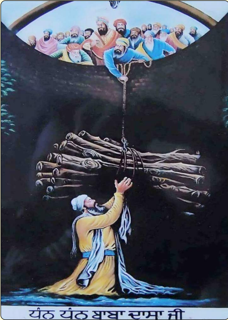
ਧੰਨ ਧੰਨ ਬਾਬਾ ਦਾਸਾ ਜੀ