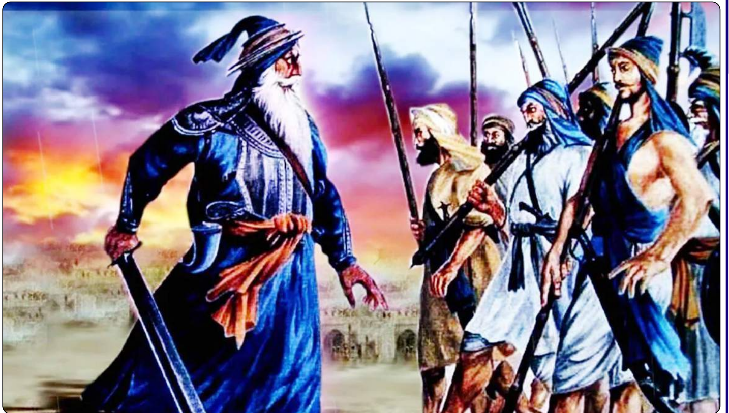
ਸ੍ਰੀ ਅੰਮ੍ਰਿਤਸਰ ਨਹੀਂ ਜਾਣ ਦਿੱਤਾ ਜਾ ਰਿਹਾ, ਮੁਗਲ ਹਾਕਮਾਂ ਨੇ ਪੂਰੀ ਅੱਤ ਚੁੱਕ ਲਈ ਹੈ। ਤਾਂ ਬਾਬਾ ਜੀ ਨੇ ਸ੍ਰੀ ਦਮਦਮਾ ਸਾਹਿਬ ਤੋਂ

ਅਖ਼ੀਰ ਸਮੇਂ ਜਦੋਂ ਬਾਬਾ ਜੀ ਨੂੰ ਪਤਾ ਲੱਗਾ ਕਿ ਅਹਿਮਦ ਸ਼ਾਹ ਅਬਦਾਲੀ ਦੀਆਂ ਫ਼ੌਜਾਂ ਸ੍ਰੀ ਦਰਬਾਰ ਸਾਹਿਬ ਦੀ ਬੇਅਦਬੀ ਕਰ ਰਹੀਆਂ ਹਨ, ਪਵਿੱਤਰ ਸਰੋਵਰ ਨੂੰ ਪੂਰ ਦਿੱਤਾ ਗਿਆ ਹੈ, ਕਿਸੇ ਨੂੰ