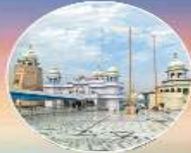
ਤਖ਼ਤ ਸ੍ਰੀ ਦਾਮਟਮਾ ਸਾਹਿਬ ਤਲਵੰਡੀ ਸਾਬੋ (ਬਠਿੰਡਾ)