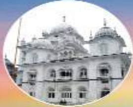
ਤਖ਼ਤ ਸ੍ਰੀ ਹਰਿਮੰਦਰ ਜੀ ਪਟਨਾ ਸਾਹਿਬ