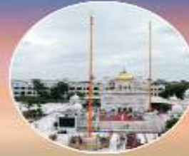
ਤਖ਼ਤ ਸ੍ਰੀ ਗੁਰੂ ਸਾਹਿਬ ਅਭਿਚਲ ਨਗਰ (ਨੌਦੇਹ)