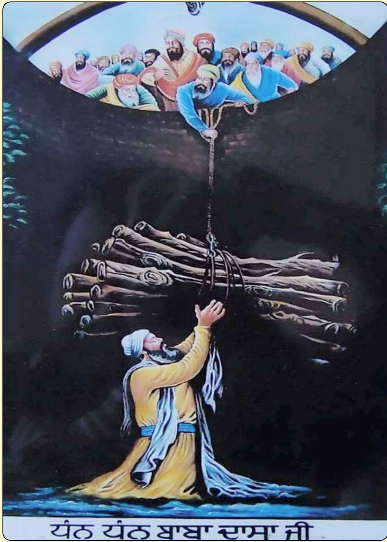
ਧੰਨ ਧੰਨ ਬਾਬਾ ਦਾਸਾ ਜੀ