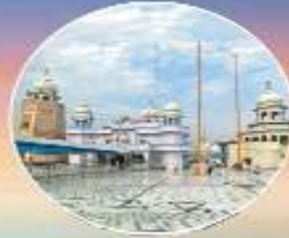
ਤਖ਼ਤ ਸ੍ਰੀ ਦਮਦਮਾ ਸਾਹਿਬ ਤਲਵੰਡੀ ਸਾਬੋ (ਬਠਿੰਡਾ)