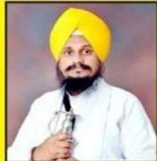
ਗਿਆਨੀ ਹਰਪ੍ਰੀਤ ਸਿੰਘ ਜੀ ਜਥੇਦਾਰ ਤਖਤ ਸ੍ਰੀ ਦਮਦਮਾ ਸਾਹਿਬ