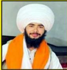
ਸੰਤ ਬਾਬਾ ਜਸਵੰਤ ਸਿੰਘ ਜੀ ਸੋਢੀ ਵਿਦਿਆਲਾ ਆਸਲ ਉਤਾੜ ਵਾਲੇ