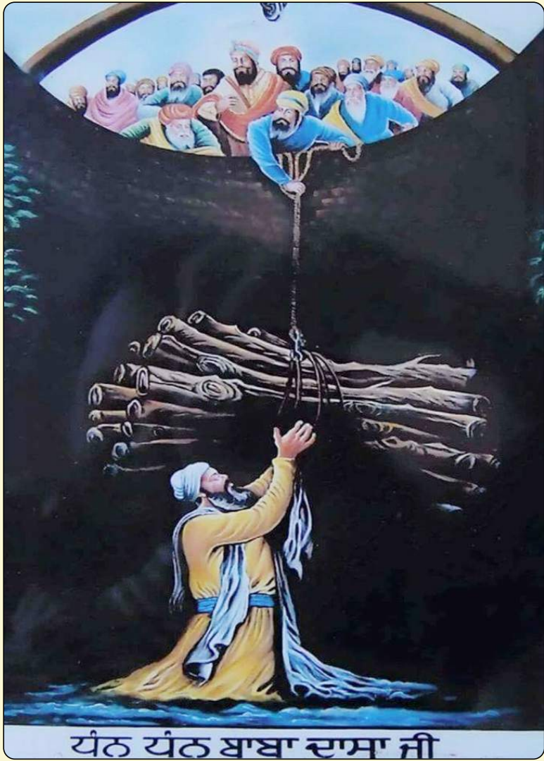
ਧੰਨ ਧੰਨ ਬਾਬਾ ਦਾਸਾ ਜੀ