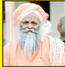
ਸੰਤ ਬਾਬਾ ਮੌਜ ਦਾਸ ਜੀ ਮਾੜੀ ਕੰਬੋਕੀ ਵਾਲੇ