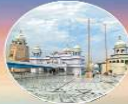
ਤਖਤ ਸ੍ਰੀ ਦਮਦਮਾ ਸਾਹਿਬ ਤਲਵੰਡੀ ਸਾਬੋ (ਬਠਿੰਡਾ)