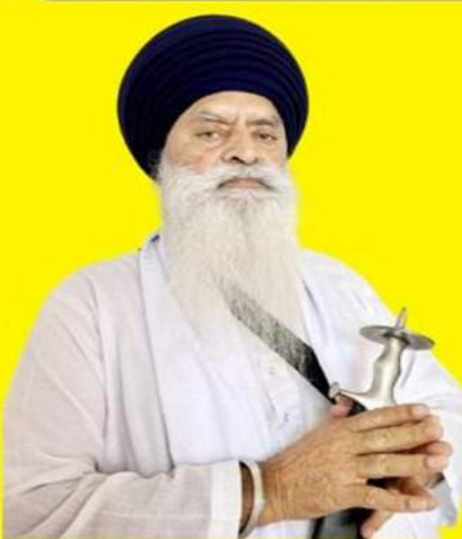
ਸਿੰਘ ਸਾਹਿਬ ਗਿਆਨੀ ਜਸਵੀਰ ਸਿੰਘ ਜੀ ਖਾਲਸਾ ਸਾਬਕਾ ਜਥੇਦਾਰ ਸ੍ਰੀ ਅਕਾਲ ਤਖਤ ਸਾਹਿਬ

ਆਵਾਜ਼ਿ ਕੌਮ AWAZE QAUM International Newspaper & WEB TV