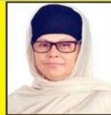
ਸੰਤ ਬੀਬੀ ਜਸਪ੍ਰੀਤ ਕੌਰ ਮਾਹਿਲਪੁਰ ਖੁੰਗੇ ਵਾਲੇ