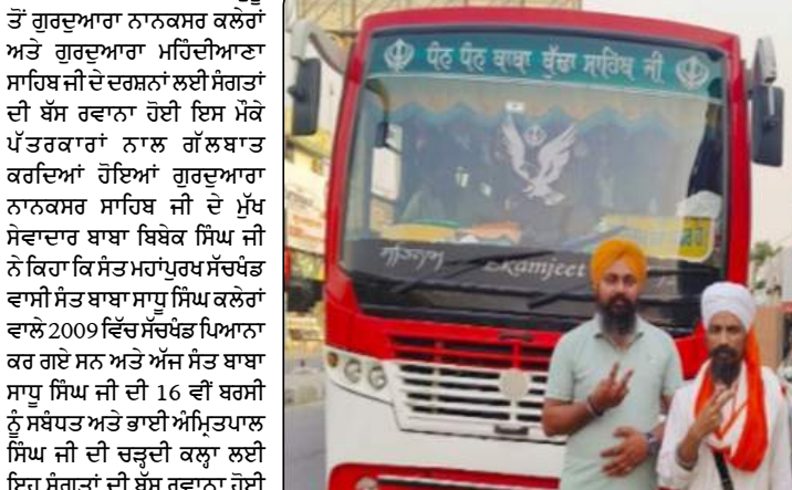
ਆਵਾਜ਼ ਕੌਮ AWAZE QAUM International Newspaper & WEB TV

ਜੇ ਅੱਗੇ ਉਨ੍ਹਾਂ ਕਿਹਾ ਕਿ ਇਸ ਬੱਸ ਵਿੱਚ ਜੰਡਿਆਲਾ ਗੁਰੂ ਨਾਨਕਸਰ ਕਲੇਰੀ ਅਤੇ ਪਿੰਡ ਸਰਜੇ ਦੀਆਂ ਵੱਡੇ ਭਾਗਾਂ ਵਾਲੀਆਂ ਸੰਗਤਾਂ ਨਾਨਕਸਰ ਕਲੇਰਾਂ ਅਤੇ ਗੁਰਦੁਆਰਾ ਮਹਿੰਦੀਆਣਾ ਸਾਹਿਬ ਜੀ ਦੇ ਦਰਸ਼ਨਾਂ ਨੂੰ ਜਾ ਰਹੀਆਂ ਹਨ ਅਤੇ ਸ਼ਾਮ ਨੂੰ ਇਹ ਬੱਸ ਵਾਪਸ ਗੁਰਦੁਆਰਾ ਨਾਨਕਸਰ ਸਾਹਿਬ ਨਾਨਕਸਰ ਨਗਰ ਜੰਡਿਆਲਾ ਗੁਰੂ ਵਿਖੇ ਪਹੁੰਚੇਗੀ ਅੱਗੇ ਉਨ੍ਹਾਂ ਸੰਗਤਾਂ ਨੂੰ ਬੇਨਤੀ ਕਰਦਿਆਂ ਹੋਇਆਂ ਕਿਹਾ ਕਿ ਗੁਰਧਾਮਾਂ ਦੇ ਦਰਸ਼ਨਾਂ ਦੇ ਨਾਲ ਨਾਲ ਸਾਨੂੰ ਗੁਰਬਾਣੀ ਗਾਉਣੀ ਚਾਹੀਦੀ ਹੈ ਅਤੇ ਬਾਣੇ ਦੇ ਪਾਰਨੀ ਵੀ ਹੋਣਾ ਚਾਹੀਦਾ ਹੈ ਤਾਂ ਕਿ ਸਾਡੇ ਜੀਵਨ ਤੋਂ ਸਾਡੇ ਬੱਚੇ ਗੁਰਮਤਿ ਦੀ ਸੇਧ ਲੈ ਕੇ ਆਪਣਾ ਜੀਵਨ ਗੁਰੂ ਆਸ਼ੇ ਅਨੁਸਾਰ ਅਤੇ ਗੁਰੂ ਵਾਲੇ ਬਣ ਕਿ ਬਤੀਤ ਕਰ ਸਕਣ।