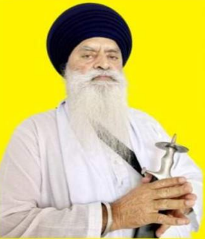
ਸਿੰਘ ਸਾਹਿਬ ਗਿਆਨੀ ਜਸਵੀਰ ਸਿੰਘ ਜੀ ਖਾਲਸਾ ਸਾਬਕਾ ਜਥੇਦਾਰ ਸ੍ਰੀ ਅਕਾਲ ਤਖਤ ਸਾਹਿਬ

ਸਮਾਗਮ ਸਵੇਰੇ 10 ਵਜੇ ਤੋਂ ਸ਼ਾਮ 3 ਵਜੇ ਤੱਕ ਹੋਵੇਗਾ ਸਭ ਸੰਗਤਾਂ ਨੂੰ ਸਮੇਂ ਸਿਰ ਪਹੁੰਚਣ ਦੀ ਸਨਿਮਰ ਬੇਨਤੀ ਹੈ ਜੀ ਪਹੁੰਚ ਰਹੀਆਂ ਪੰਥਕ ਸਖਸ਼ੀਅਤਾਂ ਅਤੇ ਸੰਤ ਮਹਾਪੁਰਸ਼