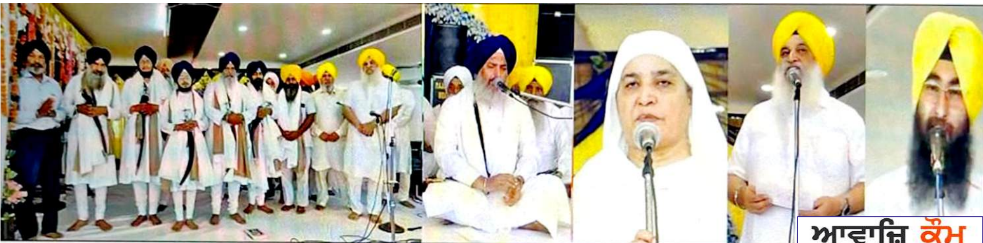
ਡੇਰਾ ਸੰਤ ਬਾਬਾ ਪ੍ਰੇਮ ਸਿੰਘ ਮੁਰਾਲੇ ਵਾਲਿਆਂ ਦੇ ਅਸਥਾਨ 'ਤੇ 'ਸਾਚਾ ਗੁਰੂ ਲਾਧੋ ਰੇ' ਸੰਬੰਧੀ ਕਰਵਾਏ ਗਏ ਧਾਰਮਿਕ ਸਮਾਗਮ ਦੇ ਵੱਖ-ਵੱਖ ਦ੍ਰਿਸ਼।