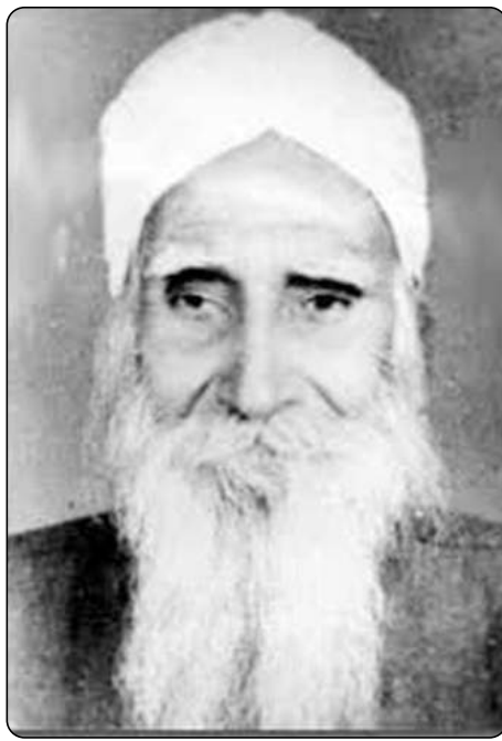
ਗਦਰੀ ਬਾਬਾ ਹਰਨਾਮ ਸਿੰਘ ਟੁੰਡੀਲਾਟ

ਨੂੰ ਉਸ ਦੇਸ਼ ਵਿੱਚੋਂ ਕੋਈ ਸਹਾਇਤਾ ਆਦਿ ਦਾ ਹੁੰਗਾਰਾ ਨਾ ਮਿਲਿਆ ਤਾਂ ਆਪ 2 ਮਾਰਚ, 1915 ਈ: ਨੂੰ ਸਾਹਪੁਰ (ਸਰਗੋਧਾ) (ਲਹਿੰਦੇ ਪੰਜਾਬ) ਦੇ ਚੌਕ ਨੰਬਰ 5 ਵਿਖੇ ਕਿਸੇ ਜਾਣਕਾਰ ਦੇ ਘਰ ਵਿਚ ਕਿਸੇ ਹੋਰ ਗ.ਦਰ ਪਾਰਟੀ ਦੇ ਸਰਗਰਮ ਸਾਥੀਆਂ ਨਾਲ ਠਹਿਰੇ ਹੋਏ ਸਨ ਤਾਂ ਸੂਹੀਏ ਤੌਤਰ ਦੀ ਖ਼ਬਰ ਨਾਲ ਸਾਰੇ ਸਾਥੀਆਂ ਸਮੇਤ ਬਾਬਾ ਹਰਨਾਮ ਸਿੰਘ ਫੜੇ ਗਏ। ਇਸ ਤੋਂ ਪਿੱਛੋਂ 13 ਦਸੰਬਰ, 1915 ਈ: ਲਾਹੌਰ ਸਾਜਿਸ਼ ਕੇਸ ਅਧੀਨ ਬਾਬਾ ਹਰਨਾਮ ਸਿੰਘ ਨੂੰ ਉਮਰ ਕੈਦ ਦੀ ਸਜ਼ਾ ਸੁਣਾਈ ਗਈ। ਬਾਬਾ ਹਰਨਾਮ ਸਿੰਘ ਬਾਕੀ ਸਾਥੀਆਂ ਸਮੇਤ ਲਗਪਗ 30 ਸਾਲ ਅੰਡਮਾਨ, ਮਦਰਾਸ, ਪੁਨਾ, ਮੁੰਬਈ, ਮਿਟਗੁਮਰੀ ਆਦਿ ਬਹੁਤ ਸਾਰੀਆਂ ਜੇਲ੍ਹਾਂ ਵਿੱਚ ਤੰਗੀਆਂ-ਤੁਰਸ਼ੀਆਂ ਤੇ ਤਸੀਹੇ ਕੱਟ ਕੇ ਦੇਸ਼ ਦੀ ਅਜ਼ਾਦੀ ਤੇ ਪੰਜਾਬ ਬਟਵਾਰੇ ਤੋਂ ਪਹਿਲਾਂ 1945 ਈ: ਨੂੰ ਜੇਲ੍ਹ ਤੋਂ ਬਾਹਰ ਆਏ। ਇਹ ਅਣਖੀ ਯੋਧਾ 80 ਸਾਲ ਦੀ ਉਮਰ ਭੋਗ ਕੇ 18 ਸਤੰਬਰ, 1962 ਈ: ਨੂੰ ਸਾਨੂੰ ਸਦੀਵੀ ਵਿਛੋੜਾ ਦੇ ਗਿਆ। ਅੱਜ ਜਦੋਂ ਮੁੜ ਪੰਜਾਬ ਆਪਣੀ ਹੋਂਦ ਲਈ ਤਰਲ ਮੱਛੀ ਹੋ ਰਿਹਾ ਹੈ, ਉਸ ਸਮੇਂ ਇਸ ਸਮੇਂ ਆਪਣੇ ਇਸ ਅਣਖੀਲੇ ਸੂਰਬੀਰ ਨੂੰ ਵੀ ਯਾਦ ਕਰ ਰਿਹਾ ਹੈ।