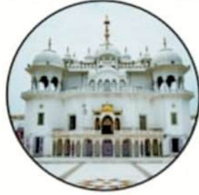
ਤਖ਼ਤ ਸ੍ਰੀ ਕੇਸਗੜ੍ਹ ਸਾਹਿਬ