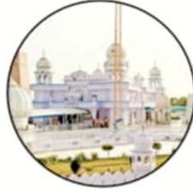
ਤਖ਼ਤ ਸ੍ਰੀ ਦਮਦਮਾ ਸਾਹਿਬ