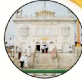
ਤਖ਼ਤ ਸ੍ਰੀ ਹਚੂਰ ਸਾਹਿਬ

ਯਾਤਰਾ ਗੁਰਦੁਆਰਾ ਦੂਖ ਨਿਵਾਰਣ ਸਾਹਿਬ, ਗੁਰੂ ਤੇਗ ਬਹਾਦਰ ਨਗਰ, ਜਲੰਧਰ ਤੋਂ