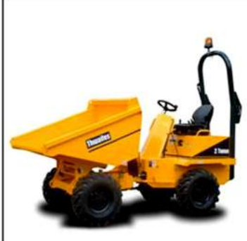
Forward Tipping Dumper