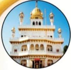
ਸ੍ਰੀ ਅਕਾਲ ਤਖ਼ਤ ਸਾਹਿਬ