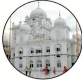
ਤਖ਼ਤ ਸ੍ਰੀ ਪਟਨਾ ਸਾਹਿਬ