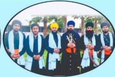
ਖੇਜਕੀਪੁਰ ਵਾਲਿਆਂ ਦਾ ਜਥਾ