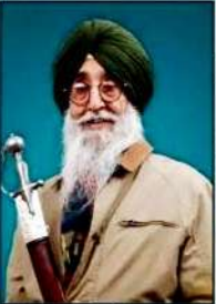
ਸਿਮਰਨਜੀਤ ਸਿੰਘ ਮਾਨ ਪ੍ਰਧਾਨ ਅਕਾਲੀ ਦਲ ਸ੍ਰੀ ਅੰਮ੍ਰਿਤਸਰ