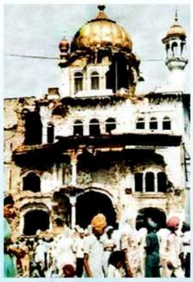
ਪਹੁੰਚ ਰਹੇ ਪੰਥਕ ਆਗੂ

ਸੂਰਾ ਸੋ ਪਹਿਚਾਨੀਐ ਜੁ ਲਰੈ ਦੀਨ ਕੇ ਹੇਤ ॥ ਪੁਰਜਾ ਪੁਰਜਾ ਕਟਿ ਮਰੈ ਕਬਹੂ ਨ ਛਾਡੈ ਖੇਤੁ ॥