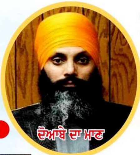
ਦੋਆਬੇ ਦਾ ਮਾਣ