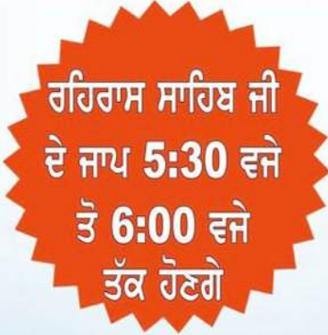
ਰਹਿਰਾਸ ਸਾਹਿਬ ਜੀ ਦੇ ਜਾਪ 5:30 ਵਜੇ ਤੋਂ 6:00 ਵਜੇ ਤੱਕ ਹੋਣਗੇ