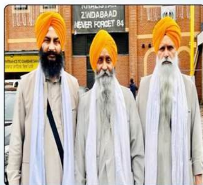
ਪੰਥ ਪ੍ਰਸਿੱਧ ਕਵੀਸ਼ਰੀ ਜਥਾ ਜਾਗੋਵਾਲਾ ਜਥਾ (6 ਵਜੇ)