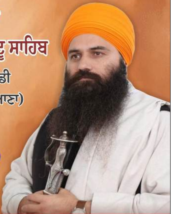
ਅਭਿਸ਼ੇਕ ਫਾਰ ਪੀਸ

ਗੁਰਦੁਆਰਾ ਸ੍ਰੀ ਗੁਰੂ ਗ੍ਰੰਥਸਰ ਦਾਦੂ ਸਾਹਿਬ ਨੇੜੇ ਕਾਲਾਂਵਾਲੀ ਮੰਡੀ ਜ਼ਿਲ੍ਹਾ ਸਿਰਸਾ (ਹਰਿਆਣਾ)