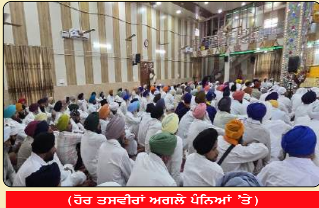
(ਹੋਰ ਤਸਵੀਰਾਂ ਅਗਲੇ ਪੰਨਿਆਂ 'ਤੇ)