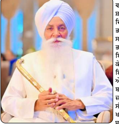
ਆਵਾਜ਼ਿ ਕੌਮ AWAZE QAUM International Newspaper & WEB TV

ਵਲੋਂ ਇਸਲਾਮ ਧਰਮ ਧਾਰਨ ਕਰਨ ਦੀਆਂ ਰੱਖੀਆਂ ਸ਼ਰਤਾਂ ਨਾ ਮੰਨਣ 'ਤੇ 10 ਨਵੰਬਰ 1675 ਈ: ਨੂੰ ਦਿਲੀ ਦੇ ਚਾਂਦਨੀ ਚੌਕ ਵਿਖੇ ਆਪ ਜੀ ਦੇ ਤਿੰਨ ਸਿੱਖਾਂ ਭਾਈ ਮਤੀ ਦਾਸ ਜੀ (ਅਰੇ ਨਾਲ ਚੀਰਿਆ), ਭਾਈ ਸਤੀ ਦਾਸ ਜੀ (ਗੁੱ 'ਚ ਵਲੋਟ ਕੇ ਅੱਗ ਲਾਈ) ਅਤੇ ਭਾਈ ਦਿਆਲਾ ਜੀ (ਪਾਣੀ ਦੀ ਉਬਲਦੀ ਦੇਗ 'ਚ ਬਿਠਾ ਕੇ) ਆਪ ਜੀ ਦੇ ਸਾਹਮਣੇ ਵੱਖ ਵੱਖ ਤਸੀਹੇ ਦੇ ਕੇ ਸ਼ਹੀਦ ਕਰ ਦਿਤਾ ਗਿਆ ਸੀ ਤਾਂ ਕਿ ਆਪ ਜੀ ਇਸਲਾਮ ਧਰਮ ਧਾਰਨ ਕਰ ਲੈਣ । ਗੁਰੂ ਜੀ ਵਲੋਂ ਵੀ ਅੰਗਰੇਜ਼ੀ ਦੀਆਂ ਸਾਰੀਆਂ ਸ਼ਰਤਾਂ ਠੁਕਰਾ ਦੇਣ ਤੋਂ ਬਾਅਦ ਅਗਲੇ ਦਿਨ 11 ਨਵੰਬਰ 1675 ਈ: ਨੂੰ ਜਲਾਦ ਵਲੋਂ ਨੌਵੇਂ ਪਾਤਸ਼ਾਹ ਜੀ ਦਾ ਤਲਵਾਰ ਨਾਲ ਸੀਸ ਕੱਟ ਦਿਤਾ ਗਿਆ । ਹਿੰਦੂ ਧਰਮ ਨੂੰ ਬਚਾਉਣ ਖਾਤਰ ਸ਼ਹੀਦ ਹੋਏ ਨੌਵੇਂ ਪਾਤਸ਼ਾਹ ਜੀ ਦੇ ਧੜ ਦਾ ਸ਼ਕਾਰ ਦਿਲੀ ਵਿਖੇ ਹੀ ਲੱਖੀ ਸ਼ਾਹ ਵਣਜਾਰੇ ਨੇ ਆਪਣੇ ਘਰ ਨੂੰ ਅੱਗ ਲਾਕੇ ਕਰ ਦਿਤਾ ਸੀ ਅਤੇ ਭਾਈ ਜੈਤਾ ਜੀ ਵਲੋਂ ਅਨੰਦਪੁਰ ਸਾਹਿਬ ਵਿਖੇ ਲਿਜਾਏ ਗਏ ਸੀਸ ਦਾ ਸ਼ਕਾਰ ਸ੍ਰੀ ਗੁਰੂ ਗੋਬਿੰਦ ਸਿੰਘ ਜੀ ਅਤੇ ਪਰਿਵਾਰ ਵਲੋਂ ਕੀਤਾ ਗਿਆ ਸੀ । ਸ੍ਰੀ ਗੁਰੂ ਤੇਗ ਬਹਾਦਰ ਸਾਹਿਬ ਜੀ ਦੀ ਸ਼ਹੀਦੀ ਮਨੁੱਖਤਾ ਦੀ ਧਾਰਮਿਕ ਆਜ਼ਾਦੀ ਨੂੰ ਕਾਇਮ ਰੱਖਣ ਦੀ ਵੱਡੀ ਮਿਸਾਲ ਹੈ । ਸ੍ਰੀ ਗੁਰੂ ਤੇਗ ਬਹਾਦਰ ਸਾਹਿਬ ਜੀ ਨੇ 54 ਸਾਲ ਦੀ ਸਰੀਰਕ ਉਮਰ ਵਿੱਚ ਰਹਿਕੇ ਸੰਸਾਰ ਦੇ ਭਲੇ ਲਈ ਜੋ ਸੁਭ ਕਾਰਜ ਕੀਤੇ ਉਨ੍ਹਾਂ ਨੂੰ ਯਾਦ ਰੱਖਣ ਲਈ ਆਪ ਜੀ ਦੇ ਸਪੁੱਤਰ ਦਸਵੇਂ ਪਾਤਸ਼ਾਹ ਸ੍ਰੀ ਗੁਰੂ ਗੋਬਿੰਦ ਸਿੰਘ ਜੀ ਵਲੋਂ ਆਪਣੀ ਰਚੀ ਬਾਣੀ ਵਿੱਚ ਜਿਥੇ ਪਹਿਲੇ ਅੰਠ ਗੁਰੂ ਸਾਹਿਬਾਨ ਦੀ ਉਸਤਤ ਕੀਤੀ ਹੈ ਉਥੇ ਆਪਣੇ ਪਿਤਾ ਜੀ ਦੀ ਉਸਤਤ ਵਿਚ ਲਿਖਿਆ ਹੈ (ਜੋ ਸਿੱਖ ਪੰਥ ਵਲੋਂ ਕੀਤੀ ਜਾਂਦੀ ਨਿੱਤ ਦੀ ਅਰਦਾਸ ਦੀਆਂ ਆਰਠੀ ਲਾਈਨਾਂ 'ਚ ਦਰਜ ਹਨ) ਕਿ ਜੋ ਵੀ ਪਾਣੀ ਸ੍ਰੀ ਗੁਰੂ ਤੇਗ ਬਹਾਦਰ ਸਾਹਿਬ ਦਾ ਸਿਮਰਨ ਕਰੇਗਾ ਉਸ ਦਾ ਘਰ ਨੌਂ ਨਿਧੀਆਂ (ਖਜ਼ਾਨਿਆਂ) ਨਾਲ ਭਰਪੂਰ ਰਹੇਗਾ ਅਤੇ ਨੌਵੇਂ ਗੁਰੂ ਜੀ ਸਿਮਰਨ ਕਰਨ ਵਾਲਿਆਂ ਦੇ ਸਦਾ ਅੰਗਸੰਗ ਰਹਿਕੇ ਸਹਾਈ ਹੋਣਗੇ । ਦਸਵੇਂ ਪਾਤਸ਼ਾਹ ਜੀ ਦਾ ਫੁਰਮਾਨ ਹੈ “ਤੇਗ ਬਹਾਦਰ ਸਿਮਰਿਐ ਘਰ ਨਉ ਨਿਧਿ ਆਵੈ ਧਾਇ । ਸਭ ਥਾਈਂ ਹੋਇ ਸਹਾਇ ।”