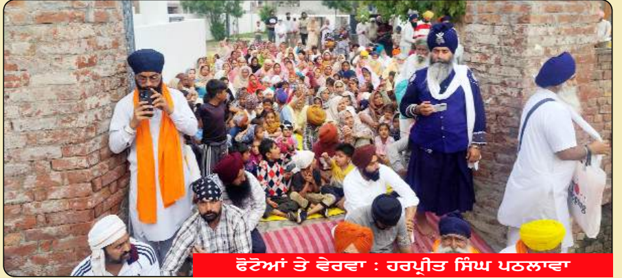
ਫੋਟੋਆਂ ਤੇ ਵੇਰਵਾ : ਹਰਪ੍ਰੀਤ ਸਿੰਘ ਪਠਲਾਵਾ