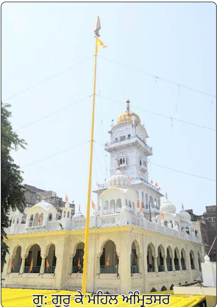
ਗੁ: ਗੁਰੂ ਕੇ ਮਹਿਲ ਅੰਮ੍ਰਿਤਸਰ

ਨੌਵੇਂ ਪਾਤਸ਼ਾਹ ਸ੍ਰੀ ਗੁਰੂ ਤੇਗ ਬਹਾਦਰ ਸਾਹਿਬ ਜੀ ਦਾ ਪ੍ਰਕਾਸ਼ 5 ਵੇਸਾਖ 1678 ਬਿਕ੍ਰਮੀ ਸੰਮਤ) ਭਾਵ 1 ਅਪ੍ਰੈਲ ਸੰਨ 1621 ਈਸਵੀ ਨੂੰ ਛੇਵੇਂ ਪਾਤਸ਼ਾਹ ਸ੍ਰੀ ਗੁਰੂ ਹਰਿਗੋਬਿੰਦ ਸਾਹਿਬ ਜੀ ਦੇ ਗ੍ਰਿਹ ਅਤੇ ਮਾਤਾ ਨਾਨਕੀ ਜੀ ਕੁੱਖ ਤੋਂ ਗੁਰੂ ਕੇ ਮਹਿਲ ਅੰਮ੍ਰਿਤਸਰ ਵਿਖੇ ਹੋਇਆ ਸੀ । ਆਪ ਜੀ ਛੇਵੇਂ ਪਾਤਸ਼ਾਹ ਜੀ ਦੇ ਸਭ ਤੋਂ ਛੋਟੇ ਸਪੁੱਤਰ ਸਨ । ਆਪ ਜੀ ਦਾ ਨਾਮ ਤਿਆਗ ਮਲ ਰਖਿਆ ਗਿਆ ਸੀ ਪਰ 1635 ਈ: 'ਚ ਕਰਤਾਰਪੁਰ ਵਿਖੇ ਛੇਵੇਂ ਪਾਤਸ਼ਾਹ ਜੀ ਦੇ ਮੁਗਲਾਂ ਨਾਲ ਹੋਏ ਧਰਮ-ਯੁੱਧ ਵਿਚ ਤਿਆਗਮਲ ਵਲੋਂ ਬਹਾਦਰੀ ਨਾਲ ਤੇਗ ਦੇ ਜੌਹਰ ਦਿਖਾਉਣ 'ਤੇ ਛੇਵੇਂ ਪਾਤਸ਼ਾਹ ਜੀ ਨੇ ਆਪ ਜੀ ਦਾ ਨਾਮ ਤਿਆਗ ਮਲ ਤੋਂ ਬਦਲਕੇ 'ਤੇਗ ਬਹਾਦਰ' ਰੱਖ ਦਿਤਾ ਸੀ । ਆਪ ਜੀ ਦਾ ਵਿਆਹ 1634 ਈ: 'ਚ ਕਰਤਾਰਪੁਰ (ਨੇੜੇ ਜਲੰਧਰ) ਨਿਵਾਸੀ ਭਾਈ ਲਾਲ ਚੰਦ ਦੀ ਅਤੇ ਬਿਸ਼ਨ ਕੌਰ ਦੀ ਸਪੁੱਤਰੀ ਮਾਤਾ ਗੁਜਰੀ ਜੀ ਨਾਲ ਹੋਇਆ ਸੀ । ਆਪ ਜੀ ਦੇ ਗ੍ਰਿਹ 32 ਸਾਲ ਬਾਅਦ ਪਟਨਾ ਸਾਹਿਬ ਵਿਖੇ ਪੋਹ ਸੂਦੀ ਸੱਤਵੀਂ ਸੰਨ 1666 ਈ: ਵਿਚ ਬਾਲ ਗੋਬਿੰਦ ਰਾਏ (ਦਸਵੇਂ ਪਾਤਸ਼ਾਹ ਸ੍ਰੀ ਗੁਰੂ ਗੋਬਿੰਦ ਸਿੰਘ ਜੀ) ਦਾ ਪ੍ਰਕਾਸ਼ ਹੋਇਆ ਸੀ ।