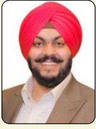
ਆਵਾਜ਼ਿ ਕੌਮ AWAZE QAUM International Newspaper & WEB TV

ਸੱਤਾ ਦੀ ਸ਼ਰੇਆਮ ਦੁਰਵਰਤੋਂ: ਕਾਂਗਰਸ ਸੰਸਦ ਮੈਂਬਰ ਨੇ ਲੋਕ ਸਭਾ ਵਿੱਚ ਪ੍ਰਧਾਨ ਮੰਤਰੀ ਮੋਦੀ ਵਿਰੁੱਧ ਵਿਸ਼ੇਸ਼ ਅਧਿਕਾਰ ਪ੍ਰਸਤਾਵ ਪੇਸ਼ ਕੀਤਾ