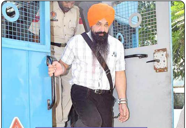
ਆਵਾਜ਼ਿ ਕੌਮ AWAZE QAUM International Newspaper & WEB TV

ਨੇ ਕੇਂਦਰ ਸਰਕਾਰ ਦੇ ਵਕੀਲ ਨੂੰ ਪੁੱਛਿਆ, “ਤੁਸੀਂ ਅਜੇ ਤੱਕ ਜਵਾਬੀ ਹਲਫ਼ਨਾਮਾ ਦਸਤਾਵੇਜ਼ ਸੀਲਬੰਦ ਲਿਫ਼ਾਫ਼ੇ ਵਿੱਚ ਅਦਾਲਤ ਵਿੱਚ ਜਮ੍ਹਾਂ ਕਰਵਾਉਣਾ ਚਾਹੁੰਦੇ ਹਨ। ਬੈਂਚ ਨੇ ਫਿਰ ਕਿਹਾ, ਆਪਣਾ ਜਵਾਬੀ ਹਲਫ਼ਨਾਮਾ ਦਾਇਰ ਕਰੋ, ਨਹੀਂ ਤਾਂ ਭਾਈ ਰਾਜੋਆਣਾ ਦੇ ਦੋਸ਼ਾਂ ਨੂੰ ਚੁਣੌਤੀ ਨਹੀਂ ਦਿੱਤੀ ਜਾ ਸਕਦੀ। ਤੁਸੀਂ ਜੇ ਵੀ ਕਹਿਣਾ ਚਾਹੁੰਦੇ ਹੋ, ਆਪਣੇ ਹਲਫ਼ਨਾਮੇ ਵਿੱਚ ਕਹੋ ਅਦਾਲਤ ਅੰਦਰ ਭਾਈ ਰਾਜੋਆਣਾ ਦੀ ਨੁਮਾਇੰਦਗੀ ਕਰ ਰਹੇ ਸੀਨੀਅਰ ਵਕੀਲ ਮੁਕੁਲ ਰੋਹਤਗੀ ਨੇ ਕਿਹਾ ਕਿ ਸ਼੍ਰੋਮਣੀ ਗੁਰਦੁਆਰਾ ਪ੍ਰਬੰਧਕ ਕਮੇਟੀ ਵੱਲੋਂ ਮਾਰਚ 2012 ਵਿੱਚ ਦਾਇਰ ਕੀਤੀ ਗਈ ਰਹਿਮ ਦੀ ਅਪੀਲ ਅਜੇ ਵੀ ਲੰਬਿਤ ਹੈ। ਉਨ੍ਹਾਂ ਕਿਹਾ ਕਿ ਸੁਪਰੀਮ ਕੋਰਟ ਨੇ 2023 ਵਿੱਚ ਕਿਹਾ ਸੀ ਕਿ ਸਬੰਧਤ ਅਧਿਕਾਰੀ ਨੂੰ ਰਹਿਮ ਦੀ ਪਟੀਸ਼ਨ 'ਤੇ ਫੈਸਲਾ ਲੈਣਾ ਚਾਹੀਦਾ ਹੈ। ਰੋਹਤਗੀ ਨੇ ਸੁਪਰੀਮ ਕੋਰਟ ਦੇ 24 ਸਤੰਬਰ, 2024 ਦੇ ਹੁਕਮ ਦਾ ਵੀ ਹਵਾਲਾ ਦਿੱਤਾ, ਜਿਸ ਵਿੱਚ ਕਿਹਾ ਗਿਆ ਸੀ ਕਿ ਜਵਾਬਦੇਹ ਧਿਰਾਂ ਵੱਲੋਂ ਹੋਰ ਕੋਈ ਮੁਲਤਵੀ ਨਹੀਂ ਕੀਤੀ ਜਾਵੇਗੀ। ਬੰਦ ਨੇ ਕੇਂਦਰ ਸਰਕਾਰ ਨੂੰ ਹਲਫ਼ਨਾਮਾ ਦਾਇਰ ਕਰਨ ਲਈ ਦੋ ਹਫ਼ਤੇ ਦਿੱਤਾ ਸੀ। ਜਸਟਿਸ ਵਿਕਰਮ ਨਾਥ, ਸਦੀਪ ਮਹਿਤਾ ਅਤੇ ਵਿਜੇ ਬਿਸ਼ਨਈ ਦੇ ਬੈਂਚ