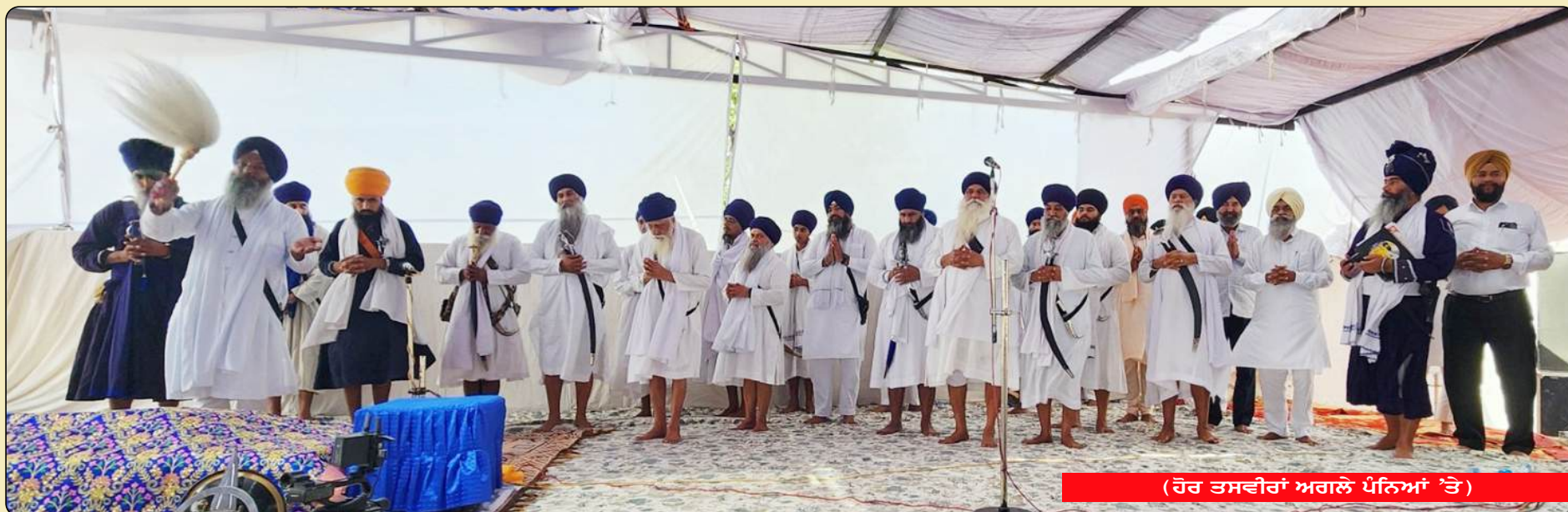
(ਹੋਰ ਤਸਵੀਰਾਂ ਅਗਲੇ ਪੰਨਿਆਂ 'ਤੇ)