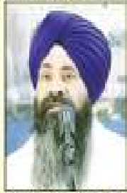
ਸਿੰਘ ਸਾਹਿਬ ਗਿਆਨੀ ਹਰਮਿੰਦਰ ਸਿੰਘ ਜੀ ਕੋਟਲੀ ਸ੍ਰੀ ਅਕਾਲ ਤਖਤ ਗੋਬਿੰਦ