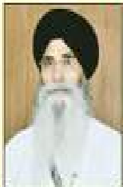
ਅੰਮ੍ਰਿਤਸਰ ਹਰਮਿੰਦਰ ਸਿੰਘ ਖਾਮੀ ਪ੍ਰਧਾਨ ਗ੍ਰਿਮਟੀ ਗੁ. ਪ੍ਰਬੰਧਕ ਕੋਟਲੀ