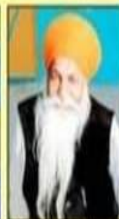
ਸੰਤ ਭਾਵਾ ਲੀਡਰ ਸਿੰਘ ਜੀ ਸੇਵਨਾਵਾਦ ਵਾਲੇ