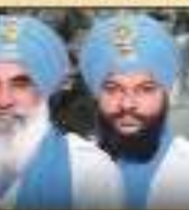
ਪੰਥ ਪ੍ਰਸਿੱਧ ਕਪੀਲਦੀ ਜਸਾ

ਬੇਨਤੀ ਕਰਤਾ : ਸੰਤਾਂ ਦਾ ਸਮੂਹ ਪਰਿਵਾਰ, ਦਮਦਮੀ ਟਕਸਾਲ, ਨਗਰ ਪੰਚਾਇਤਾਂ ਅਤੇ ਇਲਾਕਾ ਨਿਵਾਸੀ-ਸੰਗਤਾਂ। ਸੰਪਰਕ : 98140-29018, 97815-52538, 98140-13915