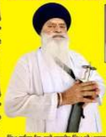
ਸਿੰਘ ਸਾਹਿਬ ਗਿਆਨੀ ਜਸਵੀਰ ਸਿੰਘ ਜੀ ਖਾਲਸਾ ਸਾਬਕਾ ਜਥੇਦਾਰ ਸ੍ਰੀ ਅਕਾਲ ਤਖਤ ਸਾਹਿਬ