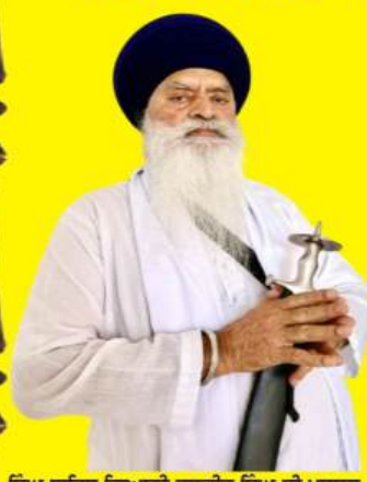
ਸਿੰਘ ਸਾਹਿਬ ਗਿਆਨੀ ਜਸਵੀਰ ਸਿੰਘ ਜੀ ਖਾਲਸਾ ਸਾਬਕਾ ਜਥੇਦਾਰ ਸ੍ਰੀ ਅਕਾਲ ਤਖਤ ਸਾਹਿਬ ਸਰਪ੍ਰਸਤ ਇੰਟਰਨੈਸ਼ਨਲ ਪੰਥਕ ਦਲ