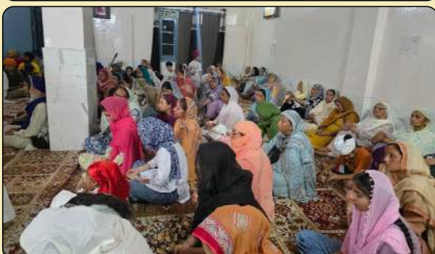
(ਹੋਰ ਤਸਵੀਰਾਂ ਅਗਲੇ ਪੰਨਿਆਂ 'ਤੇ)