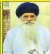
ਕਮਲੇਸ਼ ਵਲੋਂ ਸਿੰਘ ਜੀ ਵਾਲੇ ਫਿਰਕਾ ਵਾਲੇ