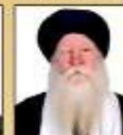
ਸੰਤ ਚਾਚਾ ਵਿਚਕਾਰ ਸਿੰਘ ਜੀ ਕੁਰਕਟ ਵਾਲੇ