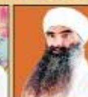
ਸੰਤ ਚਾਚਾ ਵਿਚਕਾਰ ਸਿੰਘ ਜੀ ਰੰਧੀਆ ਵਾਲੇ