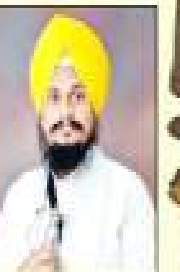
ਸਿੰਘ ਸਾਹਿਬ ਸਿੰਘ ਜੀ ਸਾਹ ਸੇਵਾ ਸੇਵਾ ਸੇਵਾ ਸੇਵਾ