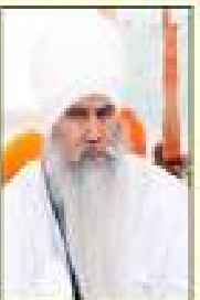
ਸੰਤ ਸਾਹਿਬ ਸਿੰਘ ਜੀ ਸਾਹ ਸੇਵਾ ਸੇਵਾ ਸੇਵਾ ਸੇਵਾ