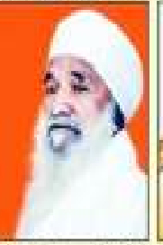
ਸੰਤ ਸਾਹਿਬ ਸਿੰਘ ਜੀ ਸੇਵਾ ਸੇਵਾ ਸੇਵਾ