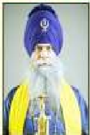
ਸੰਤ ਸਾਹਿਬ ਸਿੰਘ ਜੀ ਮੁਖੀ ਚੰਦਾ ਕਲਾ ਕਲਾਈ ਕੋਈ