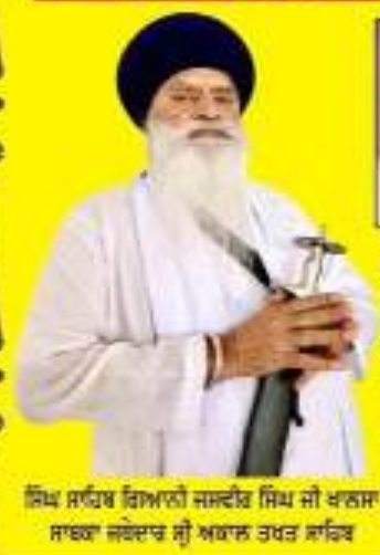
ਸਿੰਘ ਸਾਹਿਬ ਗਿਆਨੀ ਜਸਵੀਰ ਸਿੰਘ ਜੀ ਖਾਲਸਾ ਸਾਬਕਾ ਜਥੇਦਾਰ ਸ੍ਰੀ ਅਕਾਲ ਤਖਤ ਸਾਹਿਬ