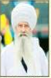
ਸੰਤ ਸਾਹਿਬ ਸਿੰਘ ਜੀ ਸੇਵਾ ਸੇਵਾ ਸੇਵਾ