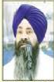
ਸਿੰਘ ਸਾਹਿਬ ਸਿੰਘ ਜੀ ਕੋਈ ਸੇਵਾ ਸੇਵਾ ਸੇਵਾ