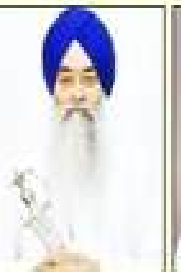
ਸਿੰਘ ਸਾਹਿਬ ਸਿੰਘ ਜੀ ਸਾਹ ਸੇਵਾ ਸੇਵਾ ਸੇਵਾ ਸੇਵਾ