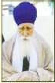
ਸੰਤ ਸਾਹਿਬ ਸਿੰਘ ਜੀ ਸੇਵਾ ਸੇਵਾ ਸੇਵਾ