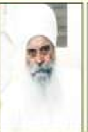
ਸੰਤ ਸਾਹਿਬ ਸਿੰਘ ਜੀ ਸਾਹ ਸੇਵਾ ਸੇਵਾ ਸੇਵਾ ਸੇਵਾ