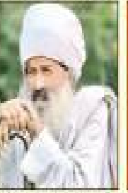
ਸੰਤ ਸਾਹਿਬ ਸਿੰਘ ਜੀ ਸੇਵਾ ਸੇਵਾ ਸੇਵਾ