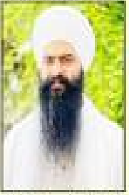
ਸੰਤ ਸਾਹਿਬ ਸਿੰਘ ਜੀ ਸੇਵਾ ਸੇਵਾ ਸੇਵਾ