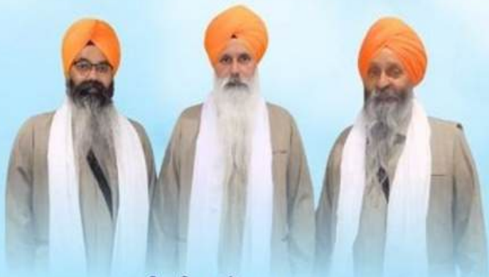
ਕਵੀਸ਼ਰੀ, ਜਾਗੋਵਾਲਾ ਜਥਾ