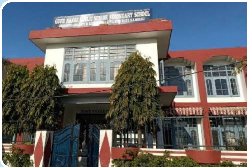
ਗੁਰੂ ਨਾਨਕ ਦੇਵ ਸੀਨੀਅਰ ਸੈਕੰਡਰੀ ਸਕੂਲ ਅੱਡਾ ਨਾਥ ਦੀ ਖੁੱਹੀ ਚੰਨਣਕੇ