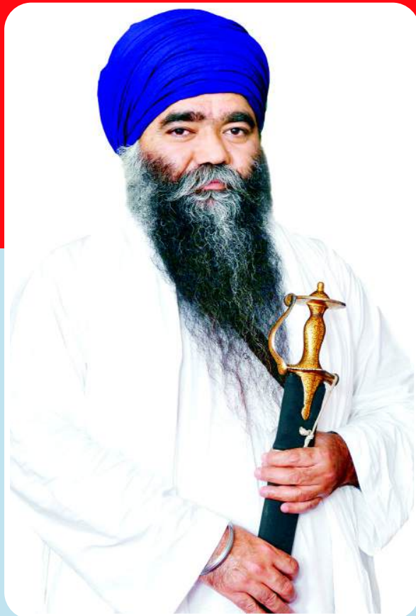
ਸੰਤ ਗਿਆਨੀ ਹਰਨਾਮ ਸਿੰਘ ਜੀ ਖਾਲਸਾ ਭਿੰਡਰਾਂਵਾਲੇ, ਮੁਖੀ ਦਮਦਮੀ ਟਕਸਾਲ