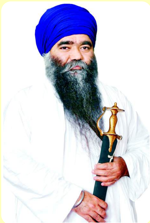
ਸੰਤ ਗਿਆਨੀ ਹਰਨਾਮ ਸਿੰਘ ਜੀ ਖਾਲਸਾ ਭਿੰਡਰਾਂਵਾਲੇ, ਮੁਖੀ ਦਮਦਮੀ ਟਕਸਾਲ

ਦਮਦਮੀ ਟਕਸਾਲ ਦੇ 14ਵੇਂ ਮੁਖੀ ਅਮਰ ਸ਼ਹੀਦ ਸੰਤ ਗਿਆਨੀ ਜਰਨੈਲ ਸਿੰਘ ਜੀ ਖਾਲਸਾ ਭਿੰਡਰਾਂਵਾਲੇ ਅਤੇ ਜੂਨ 1984 ਦੇ ਸਮੂਹ ਸ਼ਹੀਦਾਂ ਨੂੰ ਕੋਟਿਨ-ਕੋਟਿ ਪ੍ਰਣਾਮ।