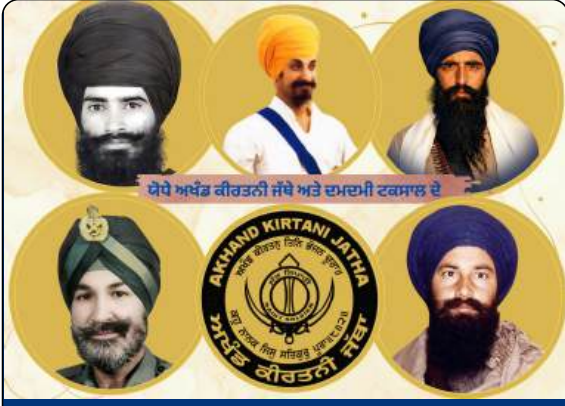
ਯੇਹੇ ਅਖੰਡ ਕੀਰਤਨੀ ਜੱਥੇ ਅਤੇ ਦਮਦਮੀ ਟਕਸਾਲ ਦੇ ਨਾਮ-ਬਾਣੀ ਵਿੱਚ ਰੰਗੇ ਹੋਏ ਗੁਰਮੁਖਾਂ ਨੇ ਸਾਬਤ ਕੀਤਾ ਖਾਲਸਾ ਕੀਰਤਨ ਕਰਨ ਵਾਲਾ ਹੀ ਨਹੀਂ, ਸਮਾਂ ਆਉਣ 'ਤੇ ਗੁਰੂ ਦੀ ਆਨ ਲਈ ਆਪਣਾ ਸਰਬੰਸ ਵਾਰ ਦੇਣ ਵਾਲਾ ਵੀ ਹੈ