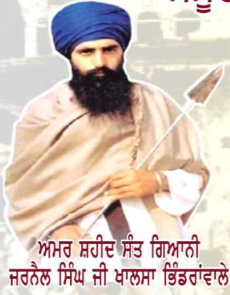
ਅਮਰ ਸ਼ਹੀਦ ਸੰਤ ਗਿਆਨੀ ਜਰਨੈਲ ਸਿੰਘ ਜੀ ਖਾਲਸਾ ਭਿੰਡਰਾਂਵਾਲੇ