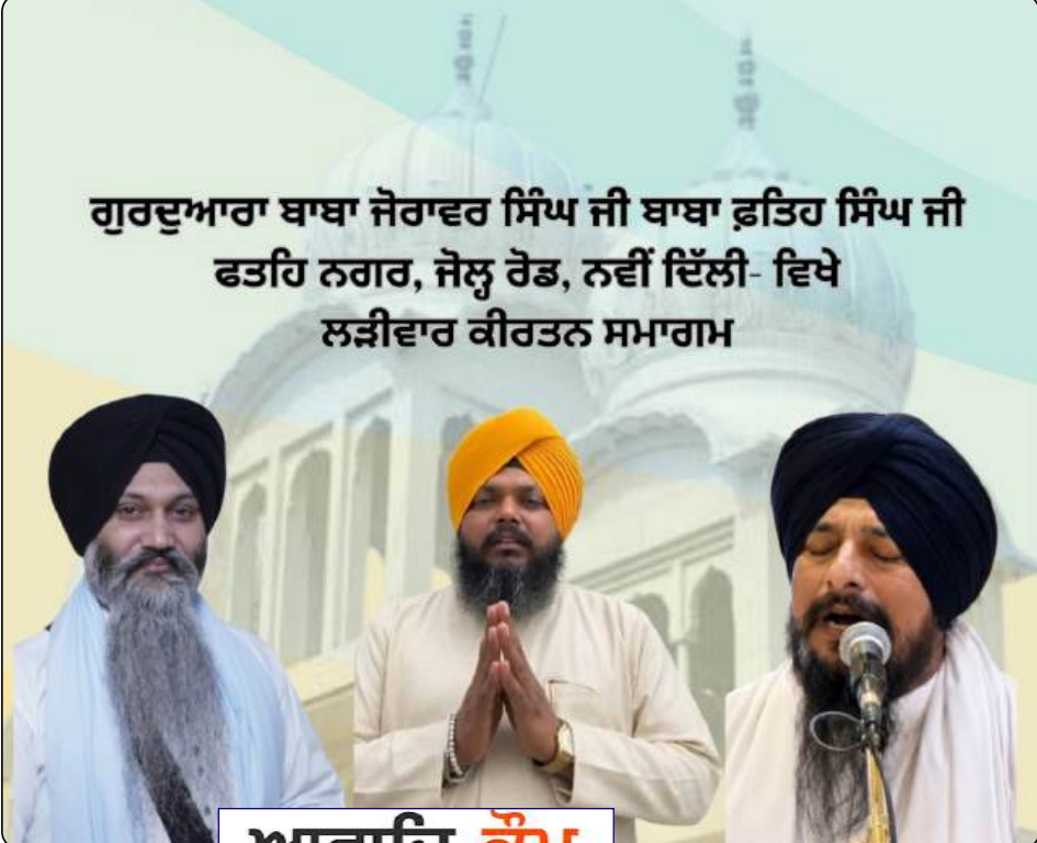
ਗੁਰਦੁਆਰਾ ਬਾਬਾ ਜੋਰਾਵਰ ਸਿੰਘ ਜੀ ਬਾਬਾ ਫਤਿਹ ਸਿੰਘ ਜੀ ਫਤਿਹ ਨਗਰ, ਜੇਲੂ ਰੋਡ, ਨਵੀਂ ਦਿੱਲੀ- ਵਿਖੇ ਲੜੀਵਾਰ ਕੀਰਤਨ ਸਮਾਗਮ